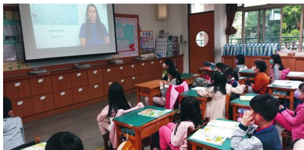
仔細聆聽外師說故事