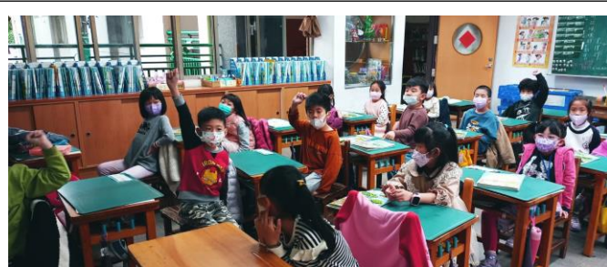
踴躍舉手回答問題